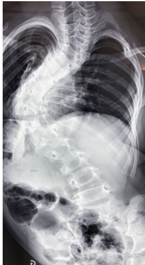
Radiographie de la colonne vertébrale de Phat avant l'intervention. SP